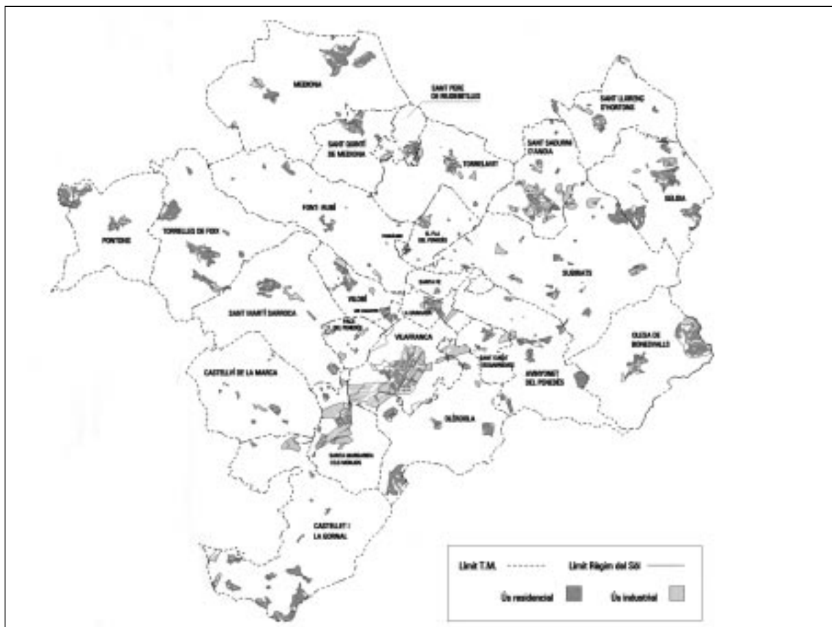
Figura 2. Usos del sòl a l'Alt Penedès

ble programat és de 16,8 ha/1.000 habitants, el segon després dels 24,9 del Garraf i per davant del Vallès Oriental (12,7), Maresme (9,7), Vallès Occidental (8,9) i Baix Llobregat (6,5). Per usos, l'Alt Penedès té l'índex més alt de sòl urbanitzable industrial, 6,6, força per davant del Vallès Oriental (4,1), Vallès Occidental (2,7), Garraf (2,3), Baix Llobregat (1,8) i Maresme (1,7).