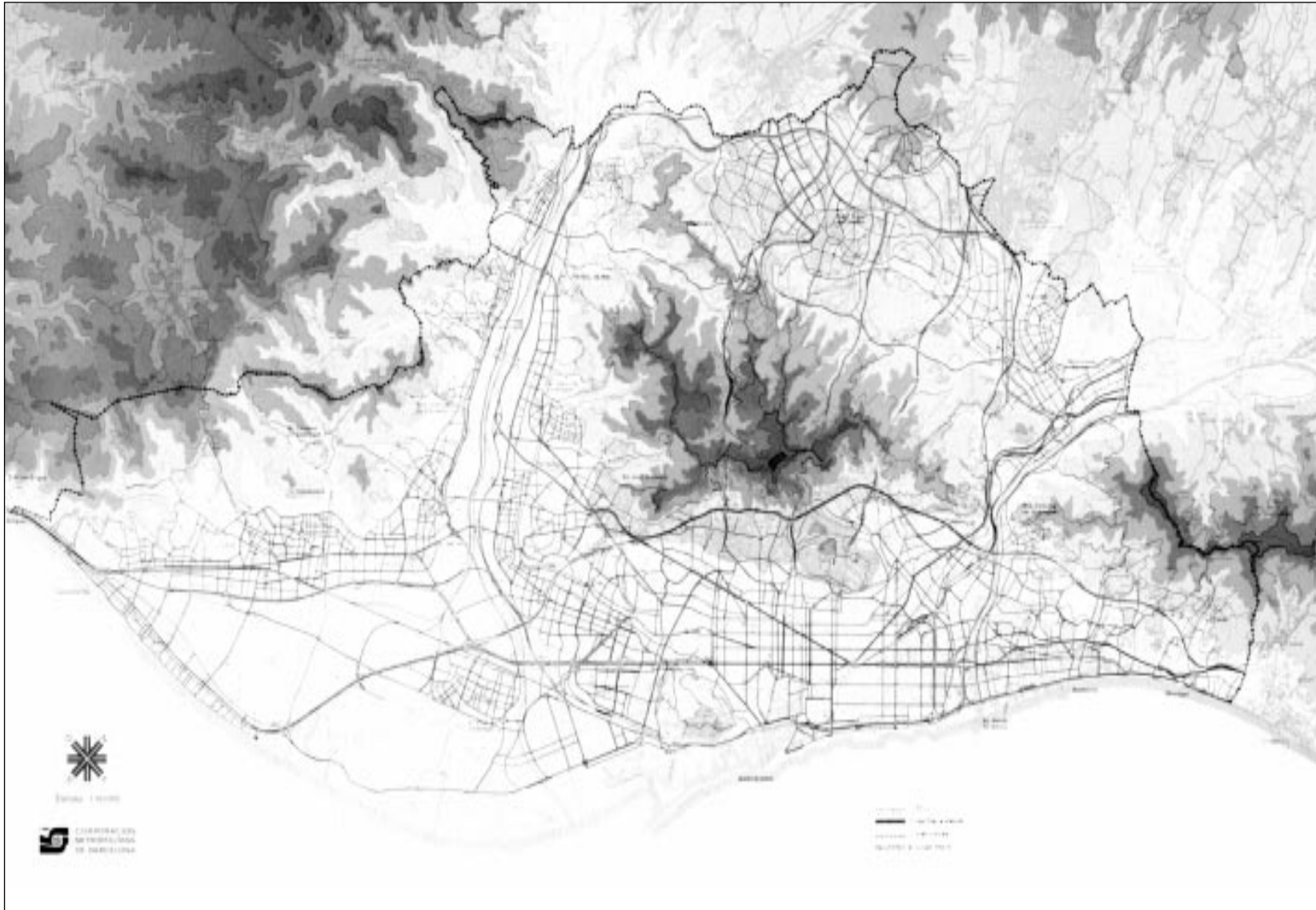
Figura 3. Pla General Metropolità d'Ordenació Urbana. Sistema viari bàsic